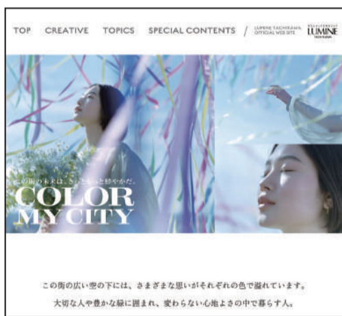
ルミネ立川40周年特設WEBサイト https://www.lumine.ne.jp/tachikawa/40th/