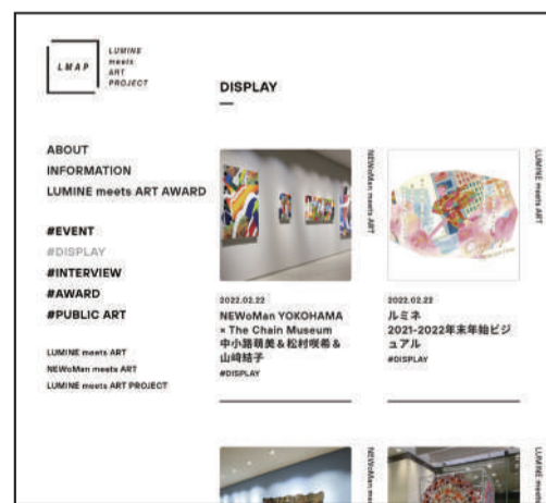
LUMINE meet ART PROJECT=LMAP https://www.lumine.ne.jp/lmap/