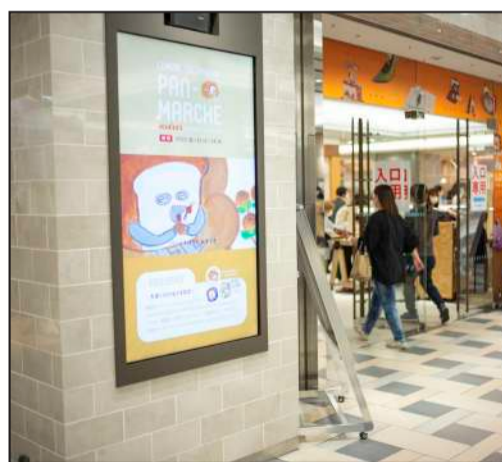
立川駅につながるコンコースのデジタルサイネージ