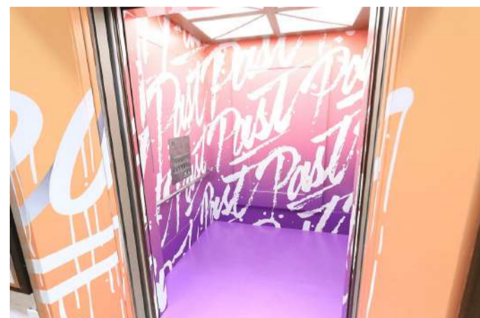
※ルミネ立川のエレベーター内側の突き当たりは、ガラス面のためラッピングできません

エントリーについての問い合わせ： LUMINE TACHIKAWA ART AWARD事務局 _____ info@luminetachikawa-art.com